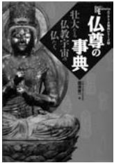
『仏尊の辞典』 関根俊一 学研

そうしたことから、仏師達は、怒りの表情の中心をにじませようかと苦心したようです。その結果、様々な表情の不動明王が存在するようになったのではないのでしょうか。